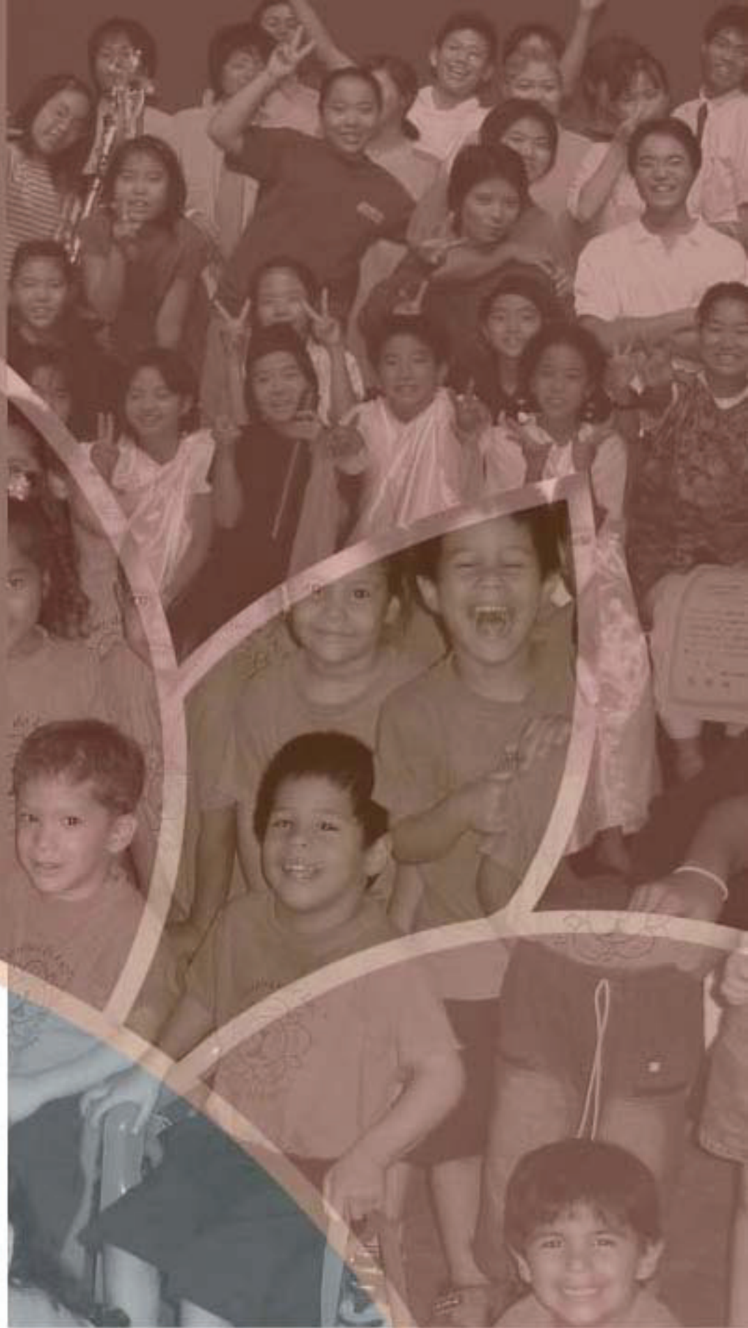
In alto: Giappone – In basso: Paraguay