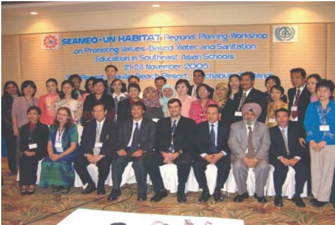
Educatori Sathya Sai aiutano il SEAMEO e l'UN-HABITAT a promuovere l'Educazione all'Uso dell'Acqua basata sui Valori Umani, nei Paesi del Sud-Est Asiatico.

La vasta esperienza acquisita dall'Educazione Sathya Sai negli ultimi quattro decenni nel portare i Valori Umani nell'istruzione in tutte le parti del mondo, ha attratto l'attenzione di molte autorità educative come anche di enti internazionali quali le Nazioni Unite. La cooperazione internazionale e lo scambio di esperienze sono di importanza primaria nell'incrementare la conoscenza e la comprensione dell'Educazione Sathya Sai, in modo che i benefici di questi programmi possano raggiungere tutti.